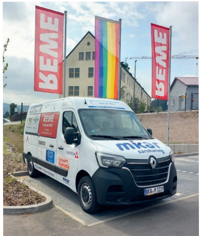
So ähnlich soll der neue CarSharing-Bus für Ihrlerstein aussehen. (Beispielbild: CarSharing-Fahrzeug Standort Nabburg)

Auszubildenden kann der Bus eingesetzt werden. Den stets einsatzbereiten Zustand inklusive Versicherung,