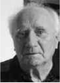
Helmut Girke 75