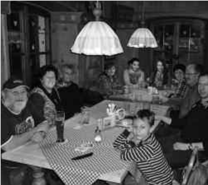
SPD Mitglieder bei der Winterwanderung im Wäscherhartl

Am 4. Januar trafen sich die Mitglieder der Brandler SPD zur alljährlichen Winterwanderung. Treffpunkt war die Wallnerkapelle. Nach etwa 45 Minuten erreichten wir das „Wäscherhartl“, wo wir einen gemütlichen Nachmittag im Ofenzimmer verbrachten.