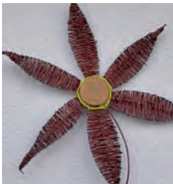
Blume aus Weiden und Birkenscheibe

Am 27. und 28. Januar 2017 finden wieder die OGV-Weidenflechtkurse statt. Gefertigt werden: