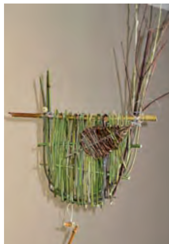
Lustige Hennen – Herzen – Kinderkurs

Nach Belieben flechten wir ein vorgefertigtes Eisengerüst mit verschiedenfarbigen Weiden und zierenden Zweigen aus.