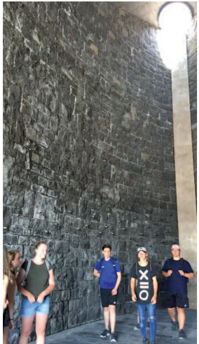
In der jüdischen Gedenkstätte des KZ