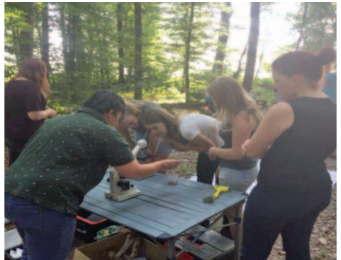
... dann wird entdeckt und geforscht!