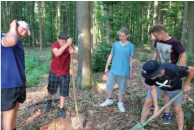
Erstmal muss gegraben werden...

Am Dienstag, den 20. Juni 2017 durften wir, die 8. Klasse der Jakob-Ihrler-Schule, eine Waldführung