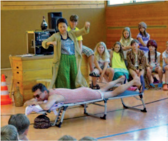
Osmins Behandlung auf der Liege