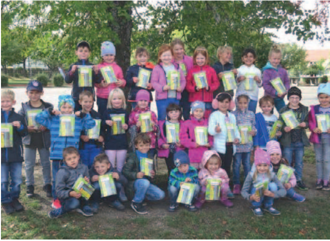
Kinder mit den Geschenken der Sparkasse

Schule und Kinder sagen ganz herzlichen Dank!