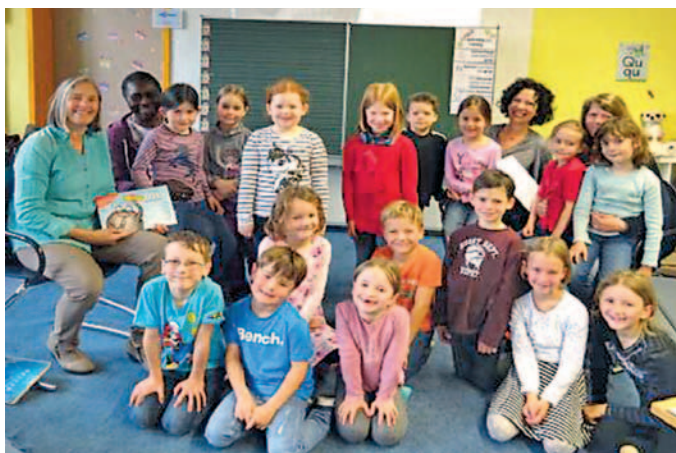
(Bericht: Gerti Festl vom Ihrlersteiner Bücherei-Team)

Wir freuen uns sehr über die gute Zusammenarbeit von Schule und Bücherei und sind stolz auf die vielen Muttis und auch Väter, die immer wieder gerne bei Aktionen aktiv mitmachen!