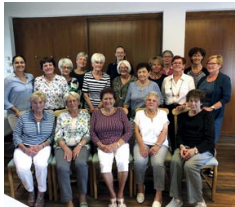
Zwei Generationen von Turnerfrauen.